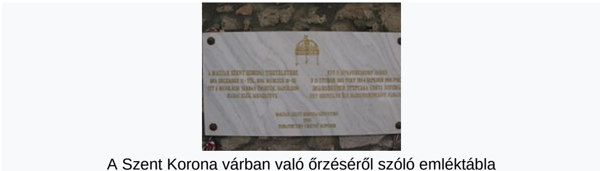
A Szent Korona várban való őrzéséről szóló emléktábla

1805. december 11-től 1806. március 10-ig, 88 napon keresztül, Napóleon elől menekítve, a várban őrizet alatt volt elrejtve a magyar Szent Korona.