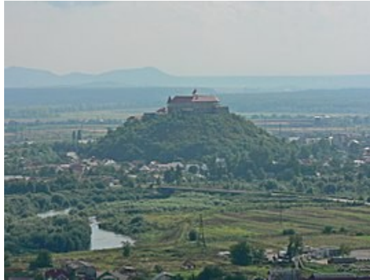
A vár látképe

A munkácsi vár (ukránul: Замок Паланок, átírással Zamok Palanok , vagyis Palánkai vár Kárpátalja legnevezetesebb, legszebb történelmi műemléke, amely fontos szerepet játszott a magyar történelemben.