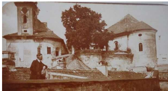
A vár 1914-ben

1896 októberében, a millenniumi ünnepek alkalmából a magyar igazságügy-minisztérium megszüntette a börtön működését, a rabokat más fegyintézetekbe szállították át. A várat a pénzügyminisztérium 393 859 koronáért megvásárolta, és a Bereg vármegyei pénzügyőrséget bízta meg fenntartásával. Erre azonban nem volt elegendő pénz, így pusztulásnak indult.