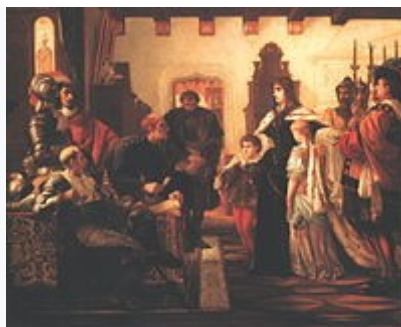
Madarász Viktor: Zrínyi Ilona vizsgálóbírái előtt

1687-ben Caprara tábornagy ismét ostrom alá vette a várat, több mint 3000 főnyi katonaságot vonultatott fel ellene. 1687. november 2-án ismét a annak feladására szólította fel Zrínyi Ilonát, aki azonban visszautasította az ajánlatot. Egy éven át tartott az osztrák ostrom, de eredménytelenül. 1687 végén azonban válságosra fordult a védők helyzete, de a védelmet nem adták fel. Ez a vár volt az egyetlen Magyarországon, amelyet az osztrákoknak nem sikerült elfoglalni. Az ellenség azonban nem adta fel a reményt, hogy megszerzi a stratégiaileg rendkívül fontos erődítményt, és újabb erőket vont össze a vár alatt.